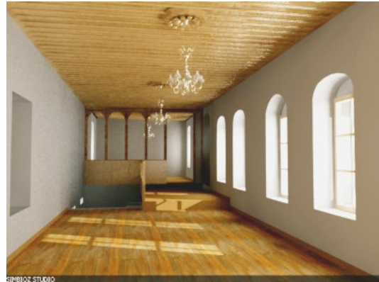
Si do të bëhet

GCDO-së për nxitjen dhe gjallërimin e prodhimit artizanal në Gjirokastrë. 3128 persona, nga të cilët 40% blerës të suvenirëve gjirokastrite, kanë vizituar vitin e kaluar këtë shitore. Kryerja e restaurimit të jashtëm hap rrugën për fazën e dytë: restaurimin e brendshëm që do të pasohet nga krijimi në këtë mjedis (kati i dytë) i një “Inkubatori të Artizanatit”. Projekti është një bashkëfinancim nga qeveria, (restaurimi i çatisë dhe fasadës), PNUD dhe GCDO. Një grup nga Swiss Contact ishte së fundi në Gjirokastrë për të shqyrtuar mundësinë e bashkëfinancimit të “Inkubatorit”. Shpresohet që ky të bëhet një model bashkëpunimi shumëpalësh, duke përfshirë edhe pronarët privatë. GCDO dhe PNUD falënderon familjen Omari për mbështetjen dhe mirëkuptimin e deritanishëm. Njëkohësisht ky projekt synon të jetë model kur restaurimi bëhet që në fillim me qëllime dhe plane të qarta për “rijetëzimin”, dmth futjen në përdorim të ndërtesave historike të papërdorura prej vitesh.